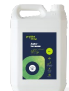
Probioway sols et multi-